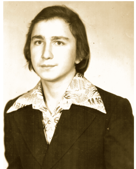
Выпускной 10 класс В, 1978 учебный год