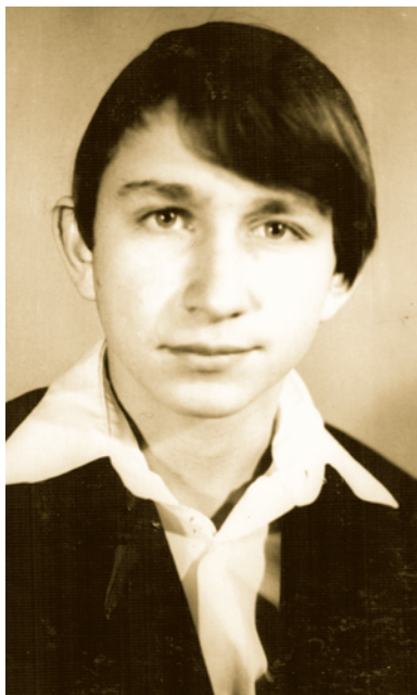
9 класс В, 1977-1978 учебный год