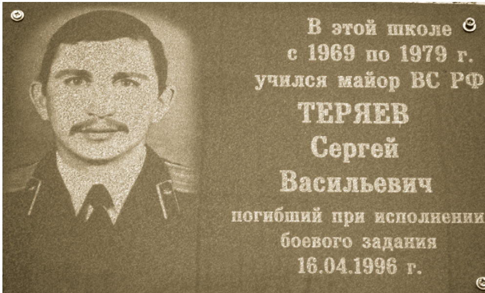
Мемориальная доска на школе № 35 в г. Полысаево