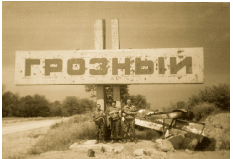
На въезде в Грозный, Слава - крайний слева