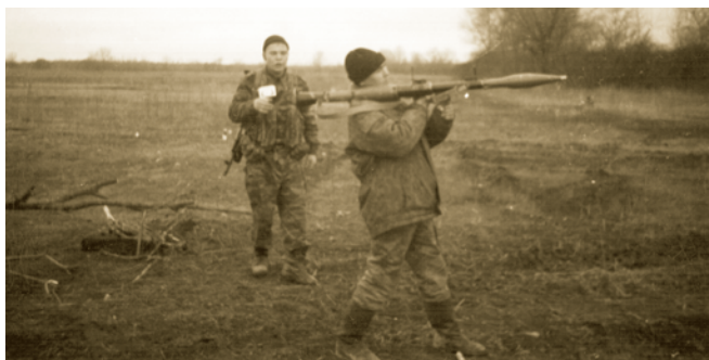
В Чечне, Слава - с оружием