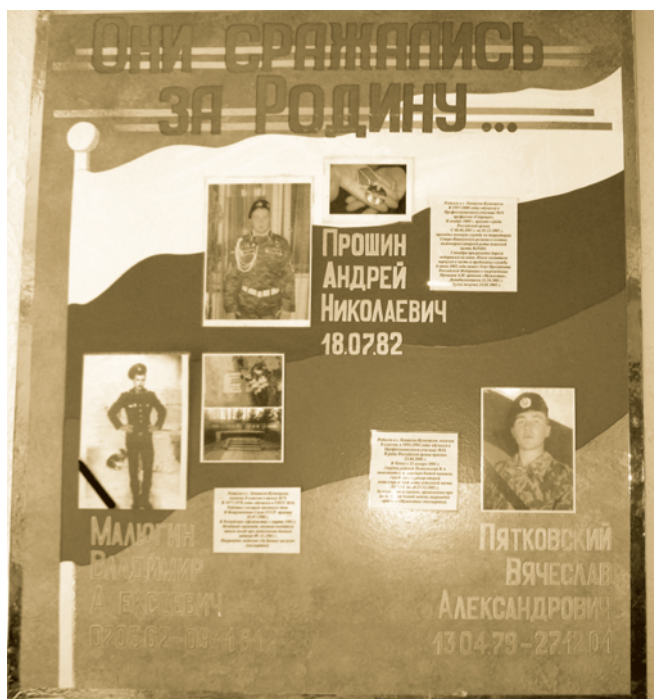
Стенд памяти выпускников в ПУ-14