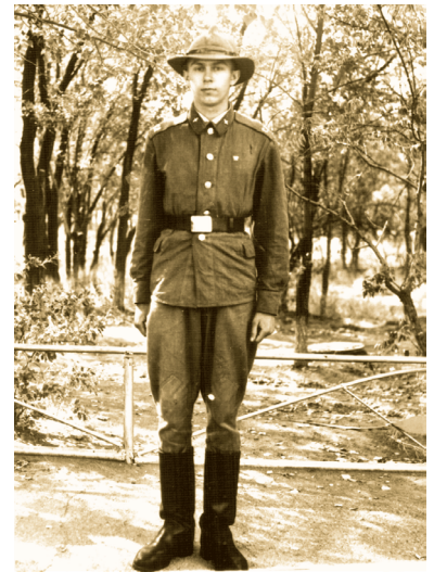
Солдат срочной службы, Байконур