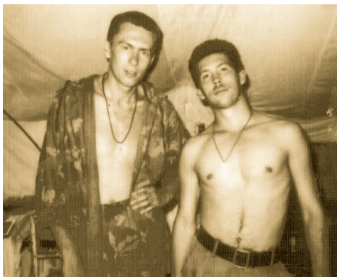
Лучший снайпер батальона Леха, Чечня, 1995 год