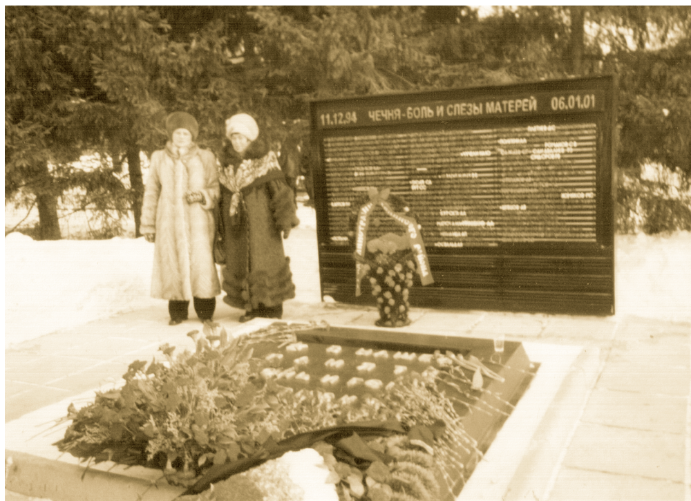
Мама с подругой у стелы погибшим в Чечне в Академгородке