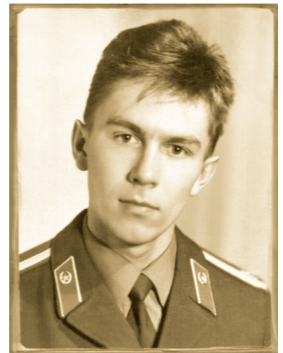
1989 г., 1-й курс НВВУ, курсант