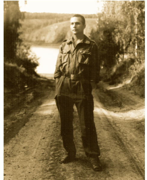
На срочной службе