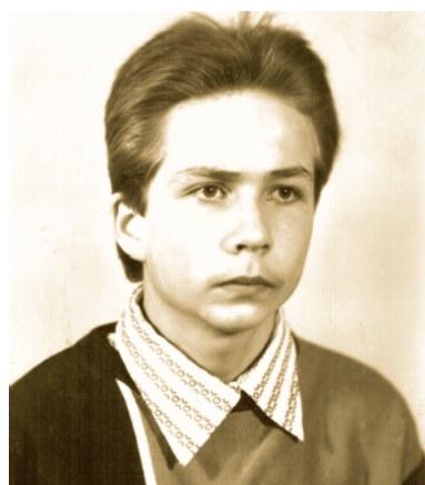
Леше 14 лет