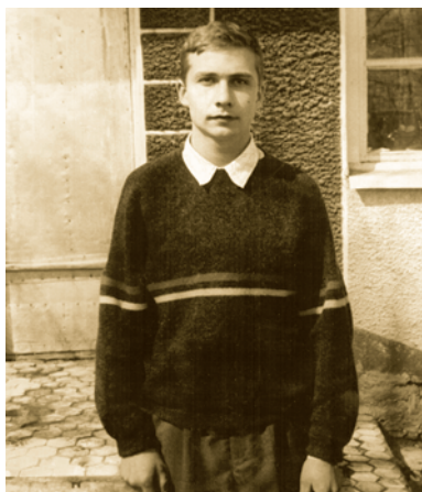
У сельсовета, д. Чусовитино, 1992 год