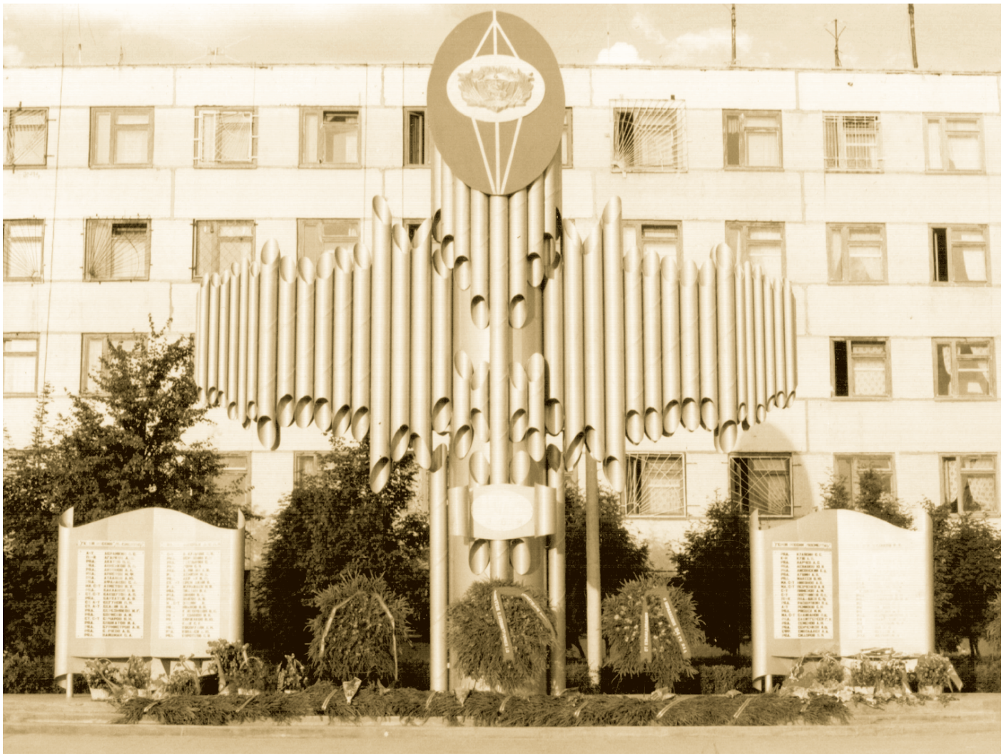
Мемориал в воинской части города Ульяновска с именами погибших в Чечне

Бой слишком неравен: Один к двадцати, И нету ни танка, ни дота, Но встала скалою врагу на пути Воздушно-десантная рота. Сказал командир, Крепче сжав автомат, «Одна у нас, братцы, забота: Как те, двадцать восемь, Ни шагу назад, Воздушно-десантная рота!» Все гуце свинец,