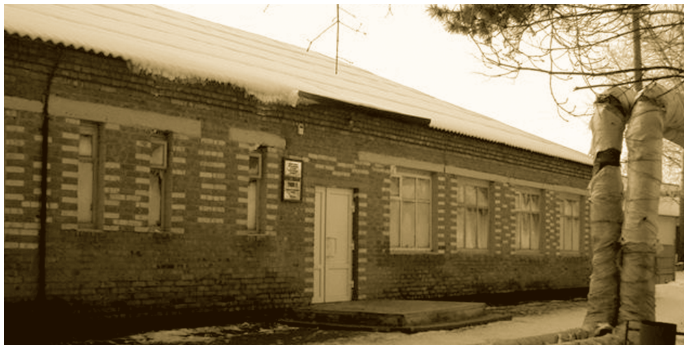
Училище № 82

Его похоронили со всеми солдатскими почестями. Но награду - орден Мужества - вручат уже отцу и матери.