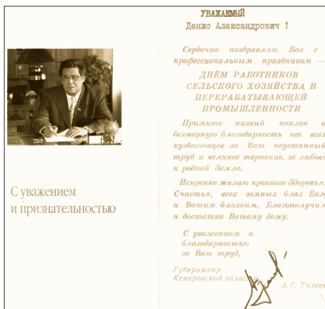
Поздравление от губернатора