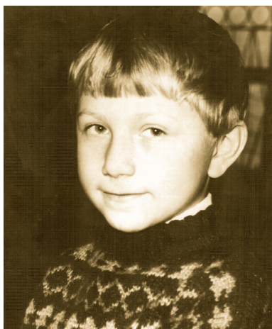
Первый класс, 1990 год

уравновешенный, все делал со смыслом, от души».