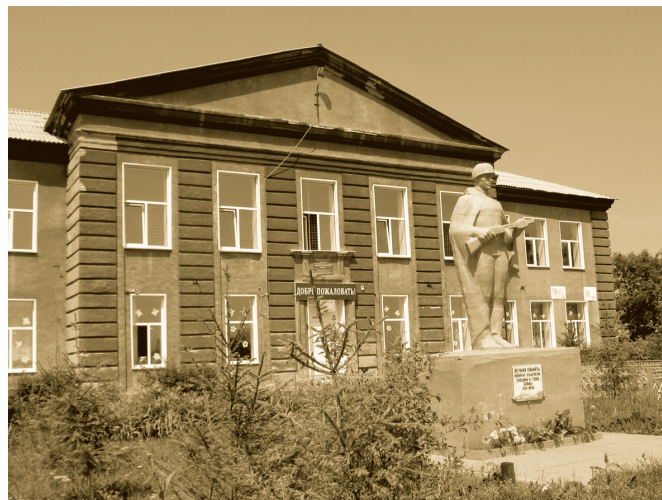
Драченинская средняя школа

надо провести качественно и в срок. Работал с утра до ночи, в пыли, кепка на лоб сдвинута, а улыбка так и сияет на лице. Добросовестно работал парень! Были и замечания со стороны инженерной службы, но не психовал, не огрызался, а принимал как должно, ведь он - комбайнер! Ему надо побыстрее все смазать, поменять или залить масло, соляру. И вот его комбайн уже в работе. Многие могли поучиться у парня расторопности, да терпению.