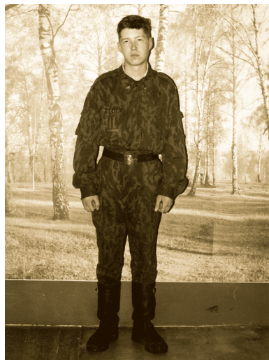
В воинской части