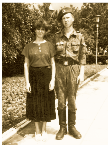
Ульяновск, воинская часть, 1994 год