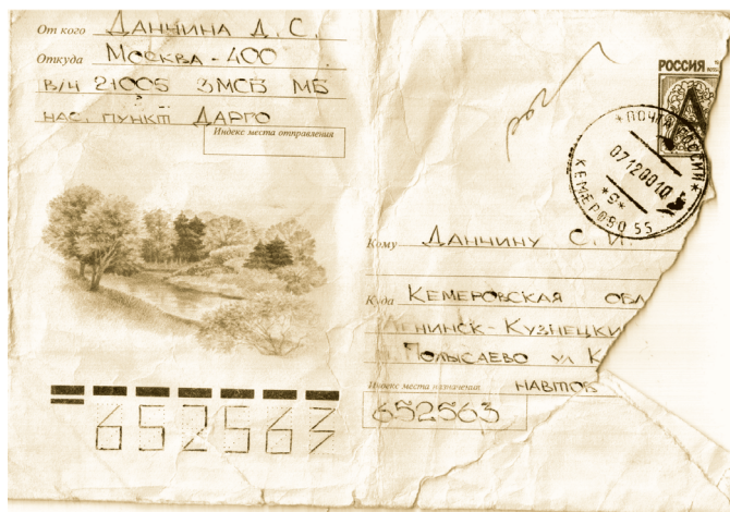
Конверт от письма из Чечни