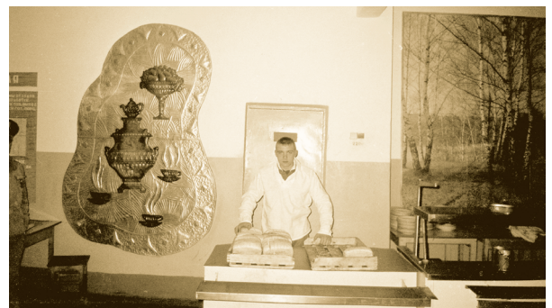
Дежурный по столовой в воинской части