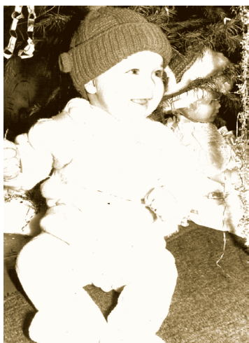
Димульке 7 месяцев. 9 февраля 1979 года