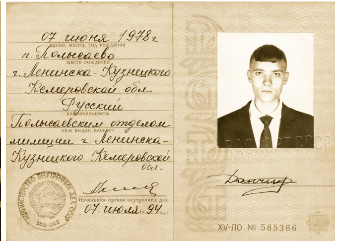
Получение паспорта в 16 лет