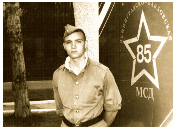
Солдат срочной службы, 1997 год, в/ч в Плотниково

Постановил: назначить по настоящему делу судебно-медицинскую экспертизу, на разрешение которой поставить следующие вопросы. Каков механизм образования, давность причинения,