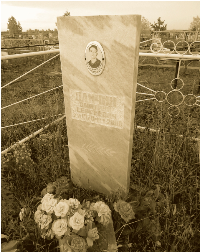
Место захоронения Дмитрия Данчина