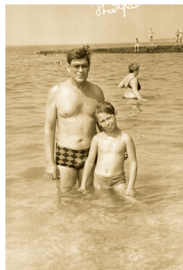
С папой на море в Новом Афоне