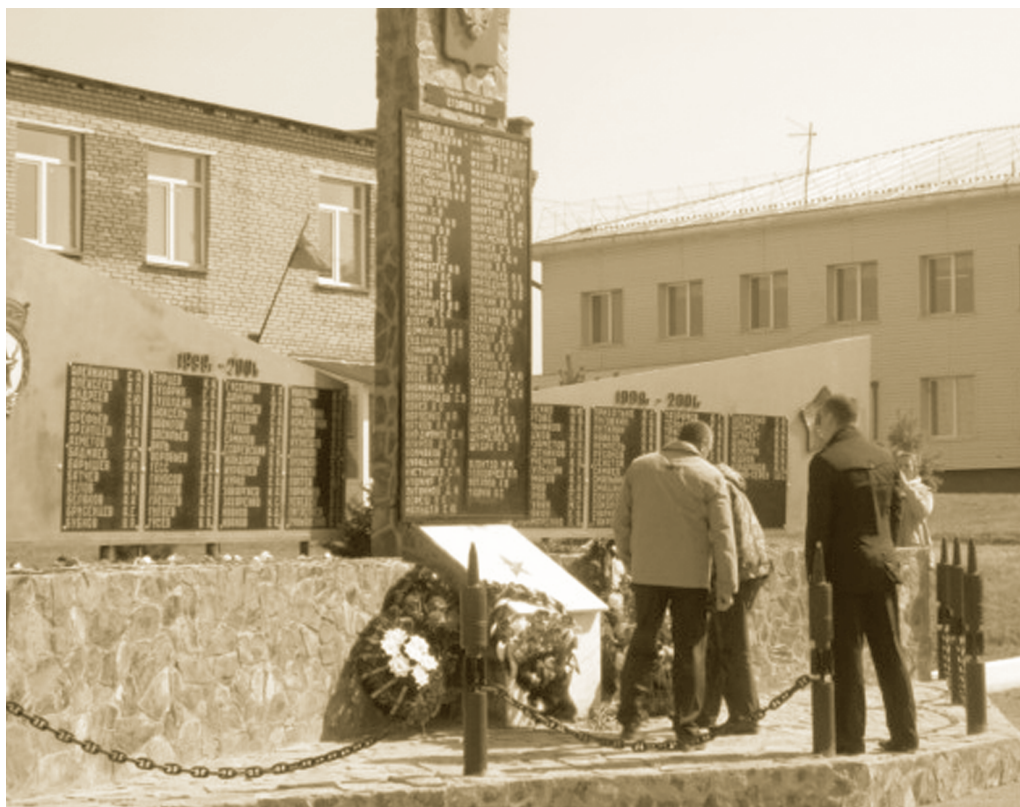
Памятник погибшим в Чечне, Юрга, в/ч 21005