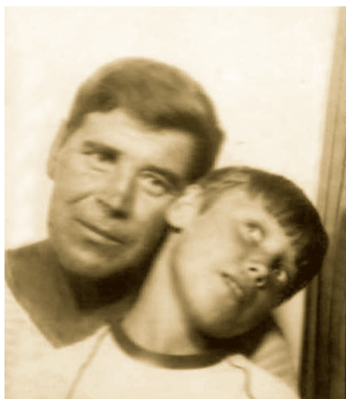
Отец и сын